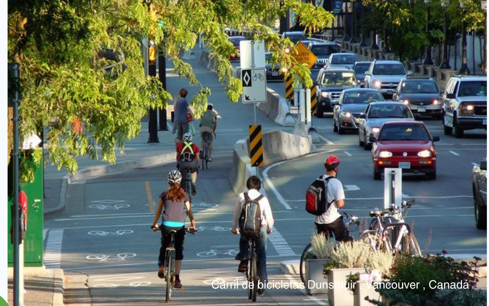
Carril de bicicletas Dunsmuir Vancouver, Canadá