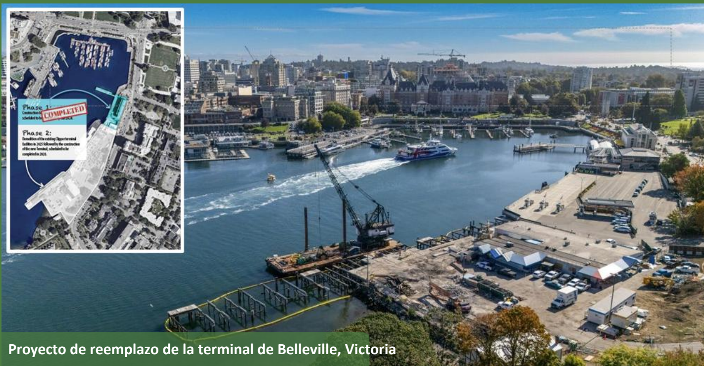
Proyecto de reemplazo de la terminal de Belleville, Victoria