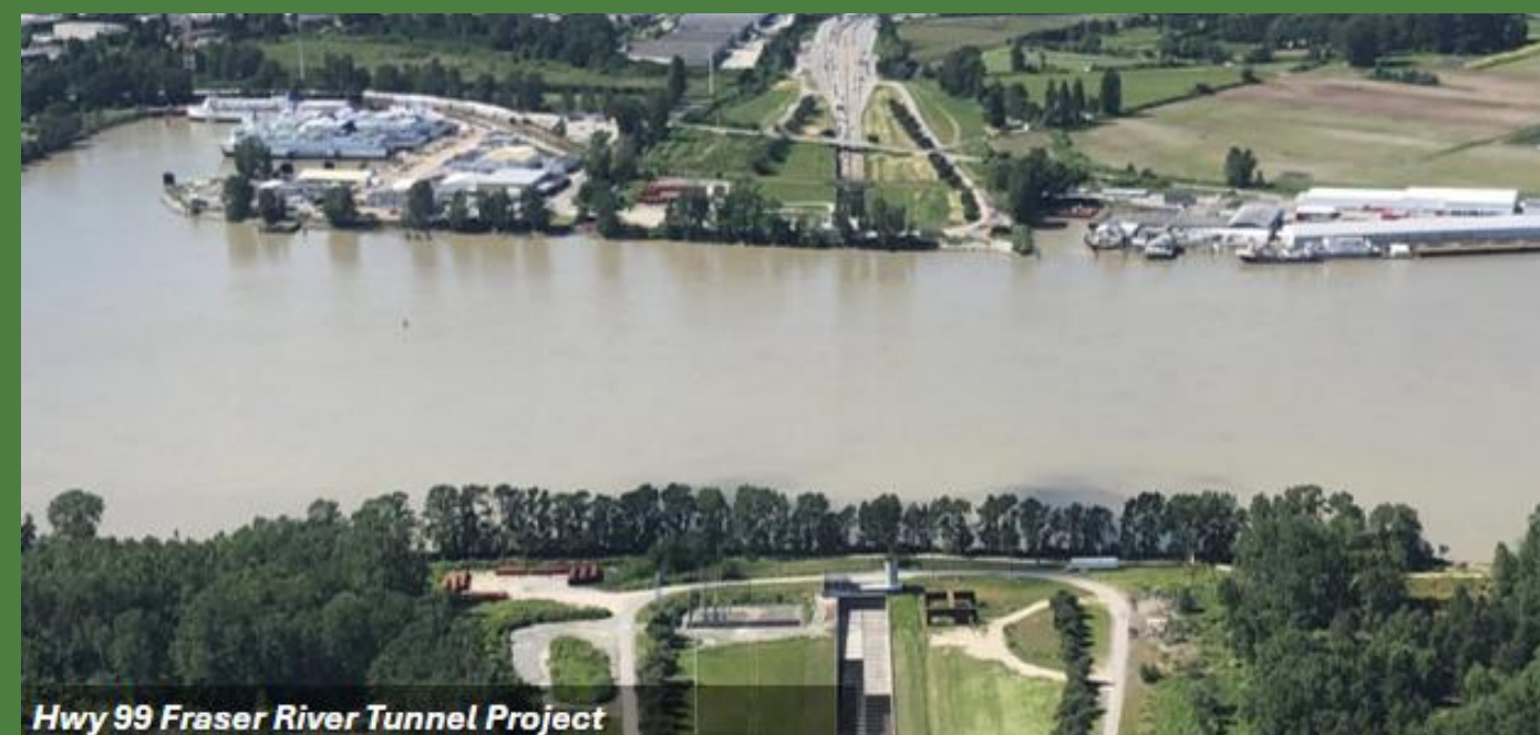
Hwy 99 Fraser River Tunnel Project