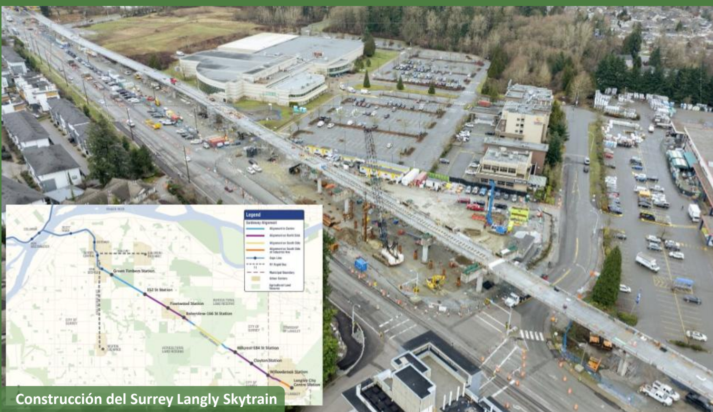
Construcción del Surrey Langley Skytrain