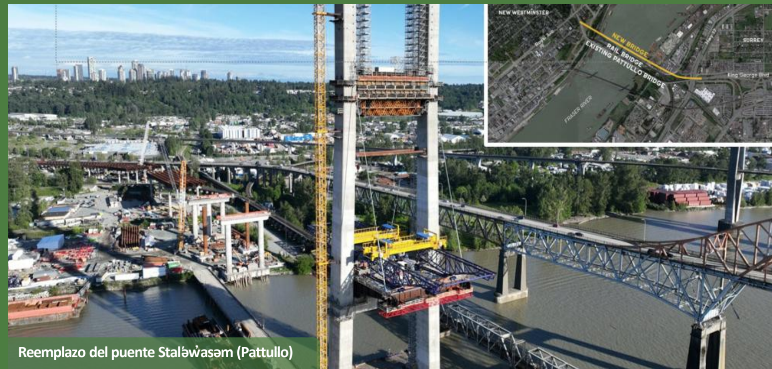
Reemplazo del puente Stalówasəm (Pattullo)