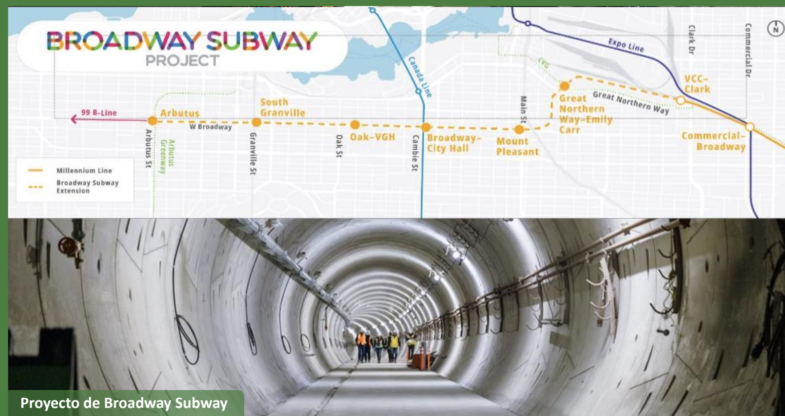
Proyecto de Broadway Subway

Mientras Vancouver es la sede del WRC 2027 se prevé que proyectos a gran escala como el reemplazo del puente Pattullo y el proyecto del túnel del río Fraser estén activamente en construcción, ofreciendo a los delegados una infraestructura compleja, multimodal en tiempo real.